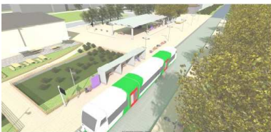
Visualisierung: Mobilitätsstation (Süd-Westen)