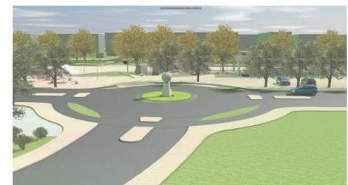
Visualisierung: Kreisverkehr (Norden)