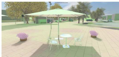
Visualisierung: Mobilitätsstation (Osten)